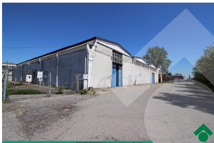
AFFILIATO TECNOCASA: Studio Industriale 1 sas - Rho (MI)